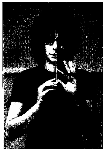
Giovanni Allevi torna stasera ad Ascoli