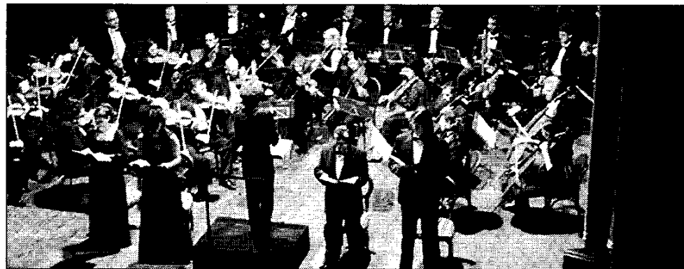
L'Orchestra internazionale d'Italia

Tantissime le presenze in questi giorni anche negli alberghi cittadini e nelle strutture legate alla ristorazione